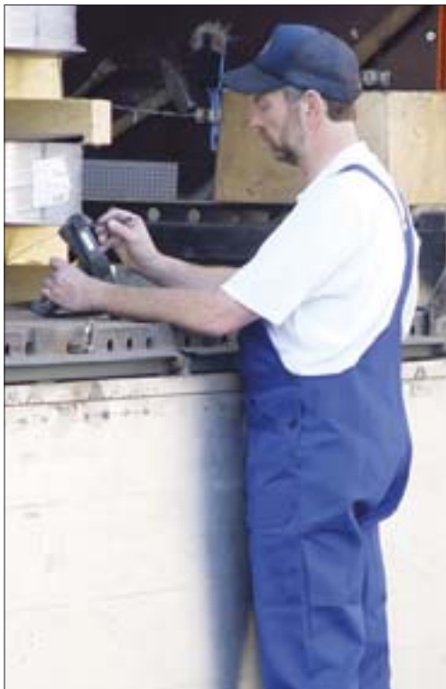
Mobile Endgeräte lesen über Barcodes die Produktinformationen ein.

Meter Edelstahlrohre jährlich. Das entspricht einem Gewicht von 50 000 Tonnen. Um den Fertigungsprozess zu optimieren, realisierte Schoeller eine Lösung zur mobilen Betriebsdatenerfassung, die im Endausbau die gesamte Produktionskette – von der Warenannahme bis zur Auslieferung – begleitet. ht